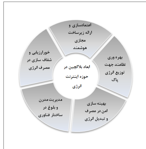
شکل ۵- ابعاد بلاک‌چین در حوزه اینترنت انرژی

تکراری و نامربوط با خواندن عنوان، چکیده و محتوا حذف گردید. در گام بعدی تجزیه و تحلیل اسناد صورت گرفت و در ادامه متن کاوی و خوشه‌بندی با استفاده از نرم‌افزار ریپید ماینر انجام گرفت. در نهایت تعداد ۱۲۴ مقاله مورد تجزیه و تحلیل قرار گرفت که در نهایت به ۱۲۵۰ واژه یا فیلد رسیدیم. با خوشه‌بندی که صورت گرفت به ۵ خوشه دست یافتیم. عناوین خوشه‌ها بدین قرار می‌باشد: اعتمادسازی و ارائه زیرساخت مجازی هوشمند، بهره‌وری نظام‌مند جهت توزیع انرژی پاک، بهینه‌سازی امن در مصرف و تبدیل انرژی، مدیریت مدرن و بلوغ در ساختار فناوری و در نهایت خودارزیابی انرژی. برای بهره‌مندی از مدل پژوهش حاضر ابتدا ابعاد شناسایی شده را در غالب شکل (۵) ترسیم می‌نماییم.